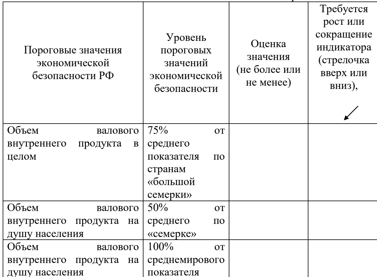
Таблица 1- Оценка пороговых значений показателей экономической безопасности Российской Федерации

Кейс 3. Выполните оценку пороговых значений показателей экономической безопасности Российской Федерации, таблица 1.