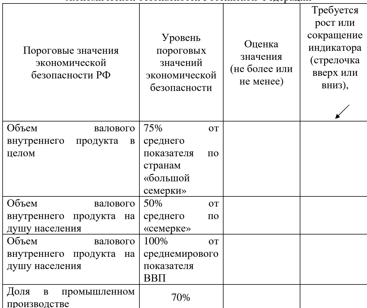
Таблица 1- Оценка пороговых значений показателей экономической безопасности Российской Федерации

Кейс 3. Выполните оценку пороговых значений показателей экономической безопасности Российской Федерации, таблица 1.